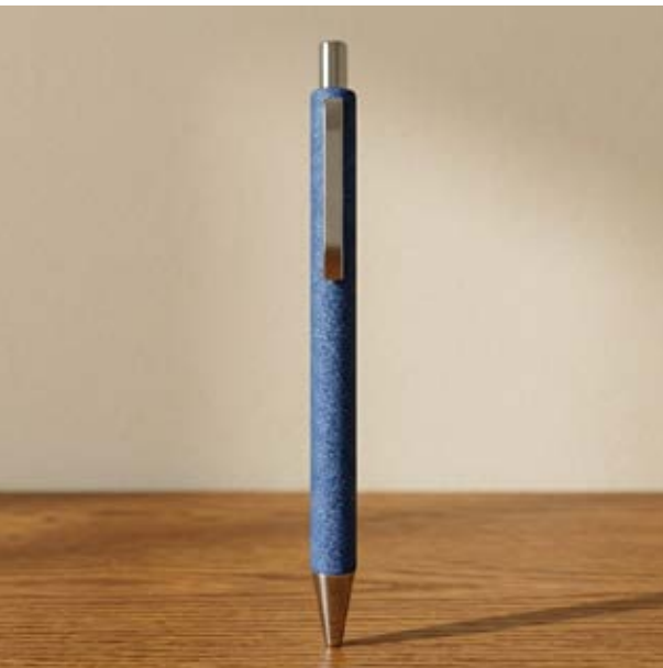
BOL 556 Bolígrafo Rodin