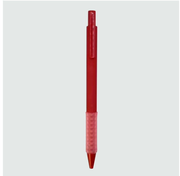
BOL 07 Bolígrafo Homer