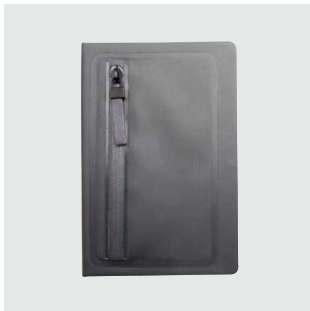
ESC 536 Libreta Denver