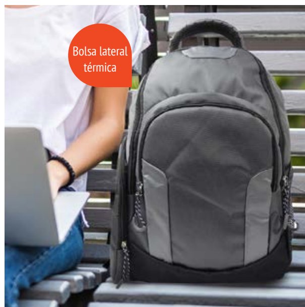
MAL 616 Backpack Sampras