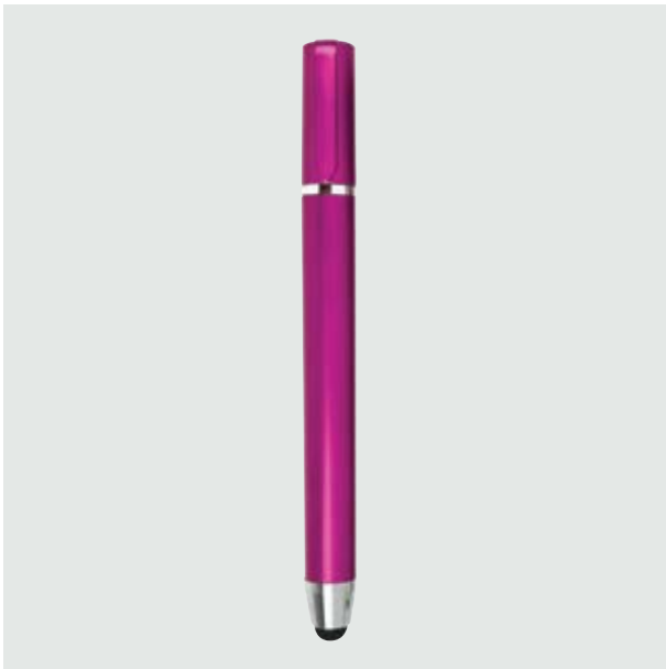
BOL 246 Bolígrafo Tuché ■ ■ ■ ■ ■