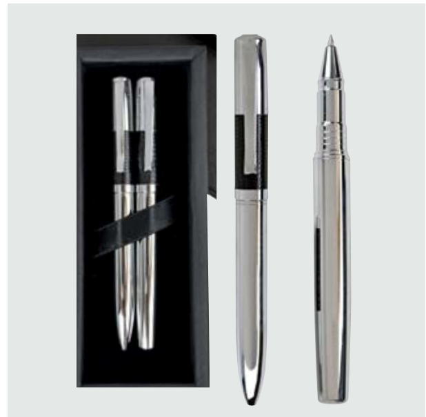
BOL 502 Set Bolígrafos Klee