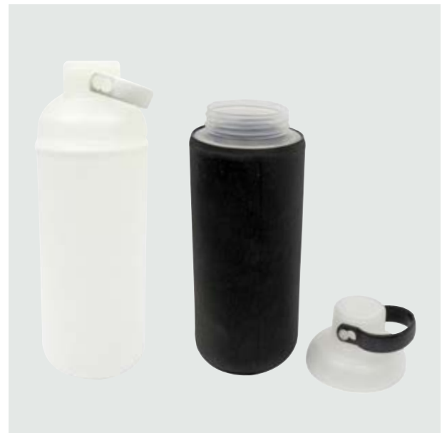
TH 115 Cilindro Soja