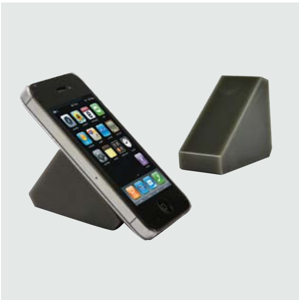
TEC 20 Tri Stand