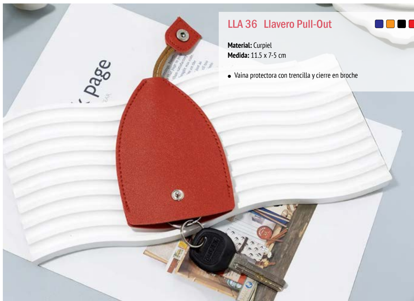
LLA 36 Llavero Pull-Out

Material: Metal y Curpiel Medida: 12.1 x 2.2 cm.