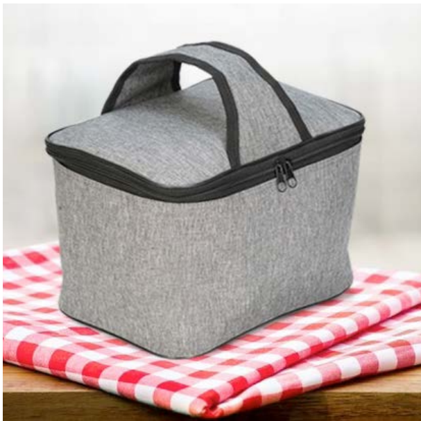
MAL 114 Lonchera Milton ■