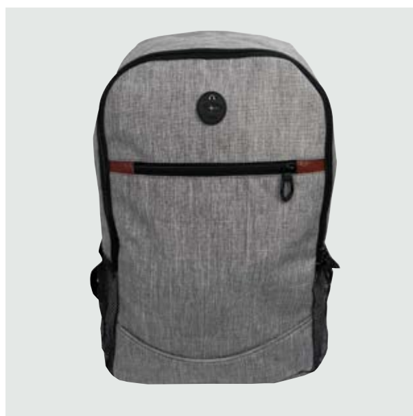
MAL 214 Backpack Dulko