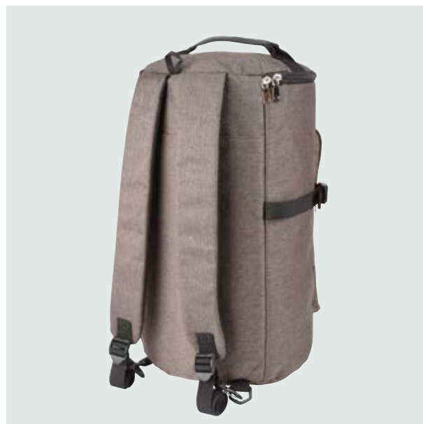
MAL 610 Backpack Harden ■