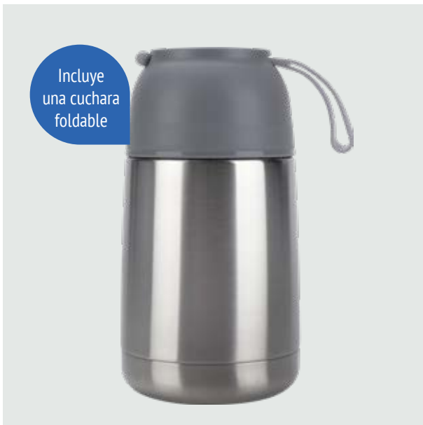
TH 30 Termo Batata