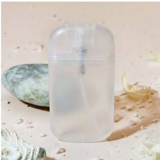
SAL 05 Oxy Sanitizer