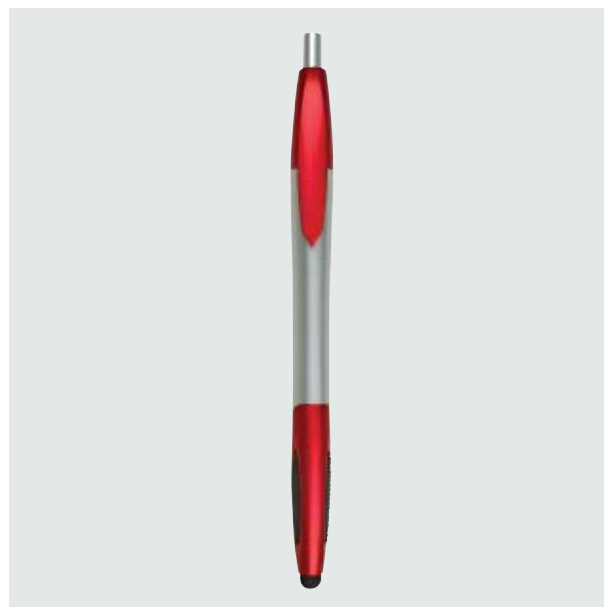
BOL 221 Bolígrafo Kapor

Material: Plástico Medida: 14.3 x 0.8 cm.