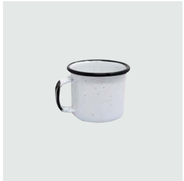
TH 212 Shot-Tequilero