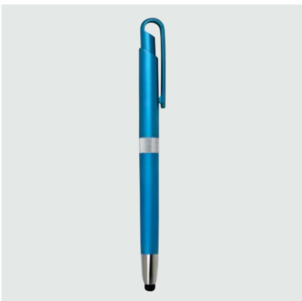
BOL 222 Bolígrafo Jasper