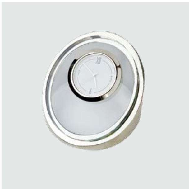
REJ 03 Reloj Tikal