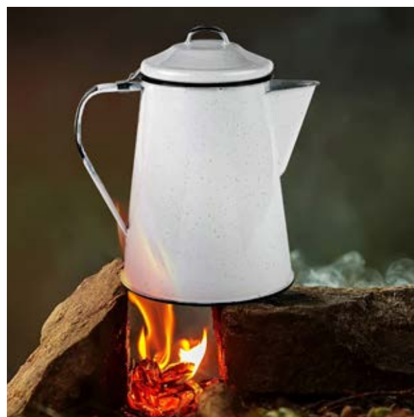
TH 51 Jarrilla Alamo