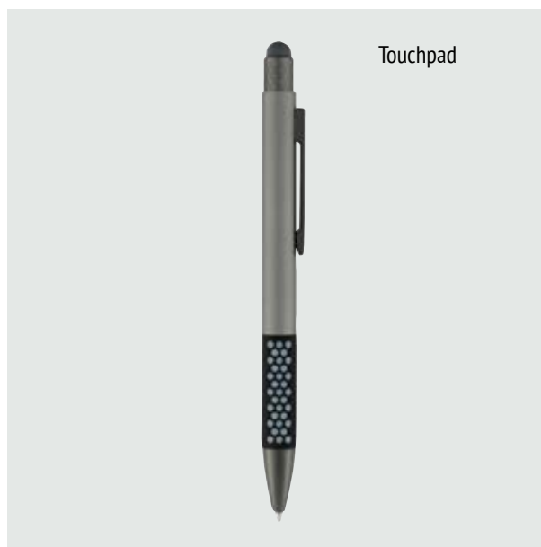
BOL 517 Bolígrafo Lloyd