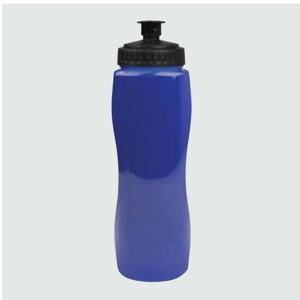
TH 104 Cilindro Ebano Sólido