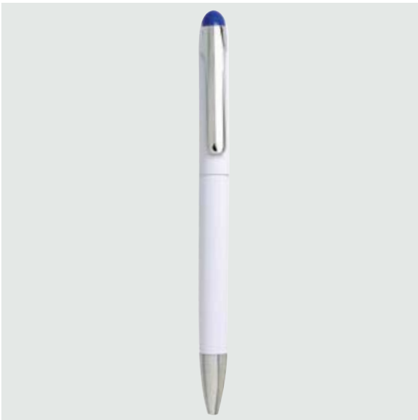
BOL 09 Bolígrafo Luke