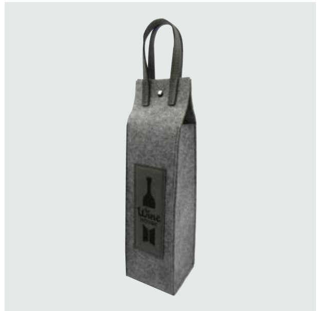
CAS 35 Portavinos Babe