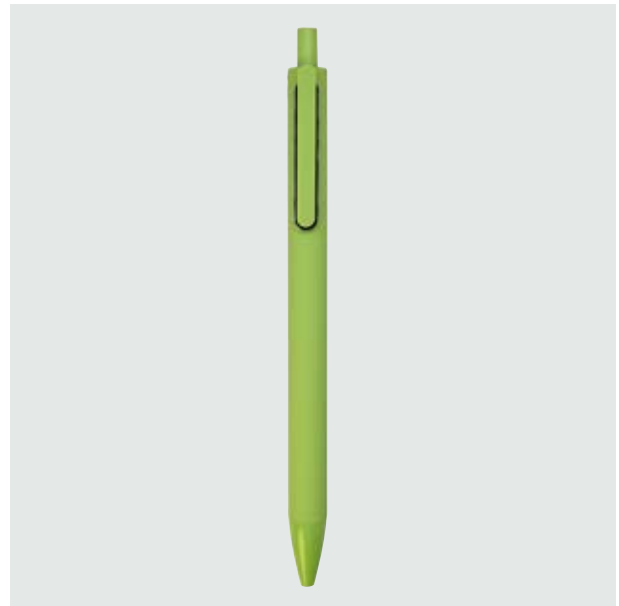
BOL 14 Bolígrafo Angélico