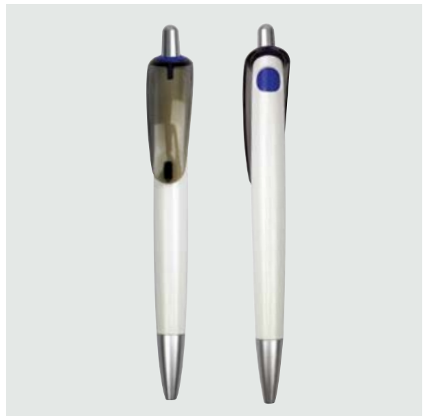
BOL 03 Bolígrafo Warhol