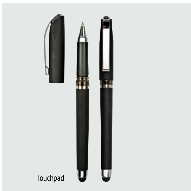
BOL 516 Bolígrafo Bosco