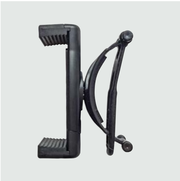
TEC 15 Pascal Holder