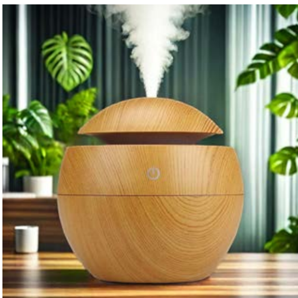
CAS 00 Vaporizador Redondo