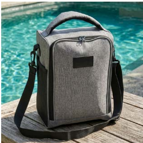
MAL 108 Lonchera Lombardi