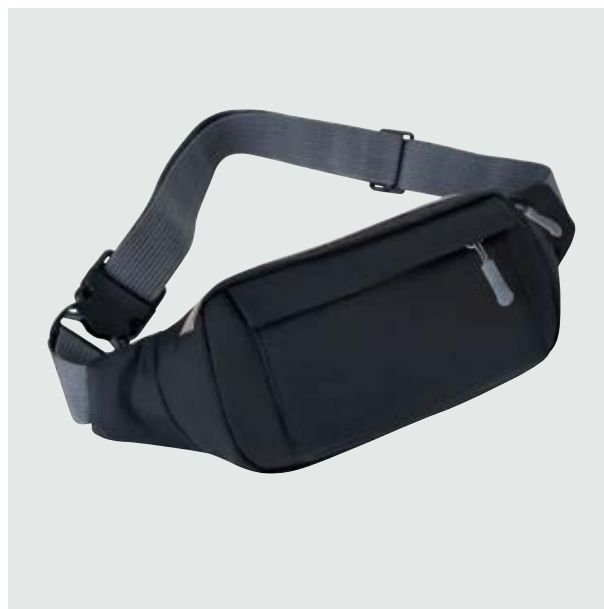
MAL 223 Cangurera O'Neal