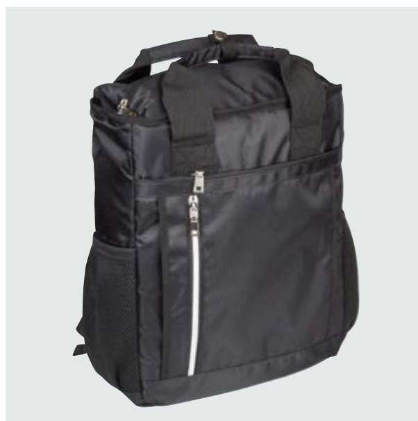
MAL 113 Lonchera Hamilton