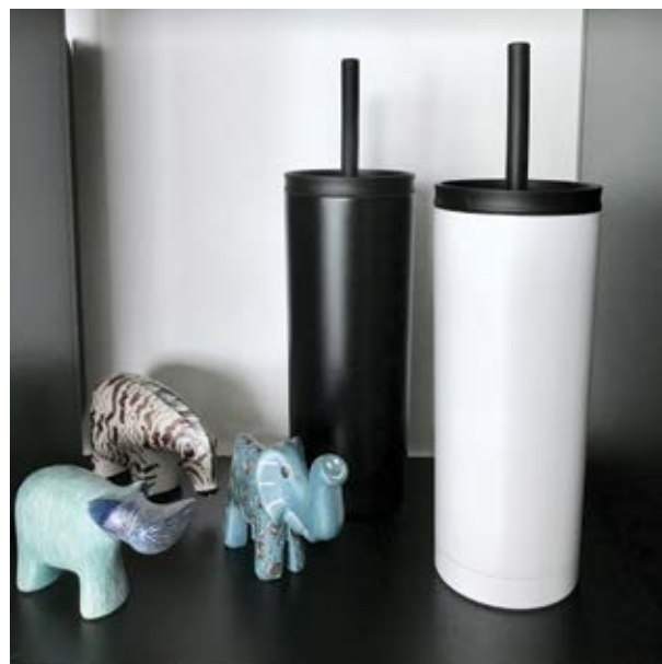
TH 09 Termo Aloe