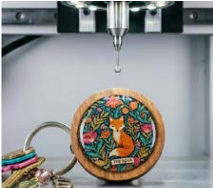
Gota de Resina

Lo anterior da como resultado una personalización impresa o grabada de nuestros productos con alta calidad garantizada.