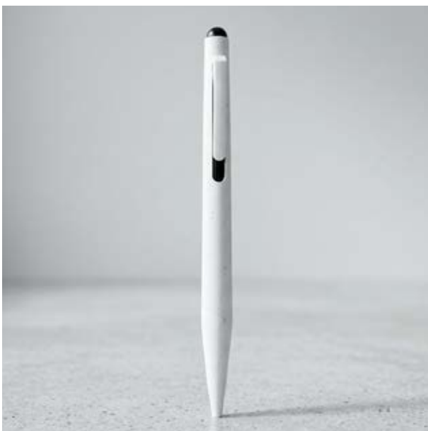
BOL 330 Bolígrafo Gibrán