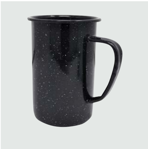
TH 213 Tarro Cervecero