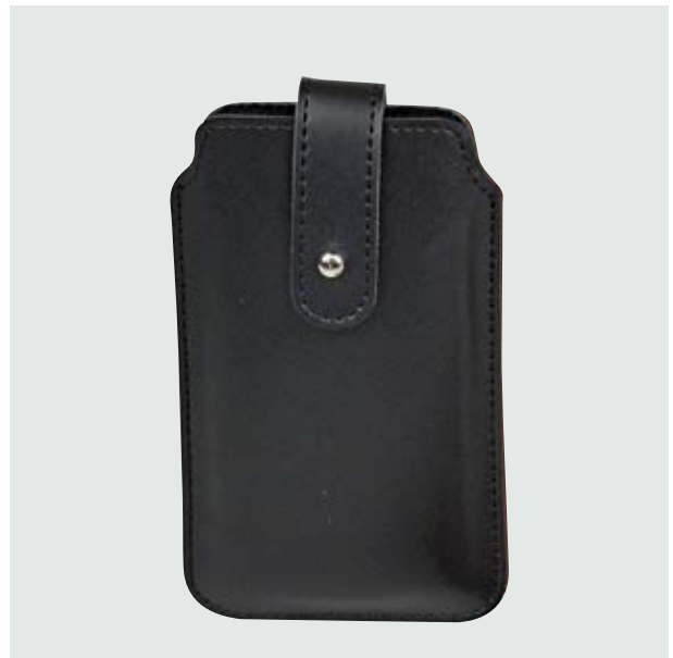
TEC 26 Phone-Case