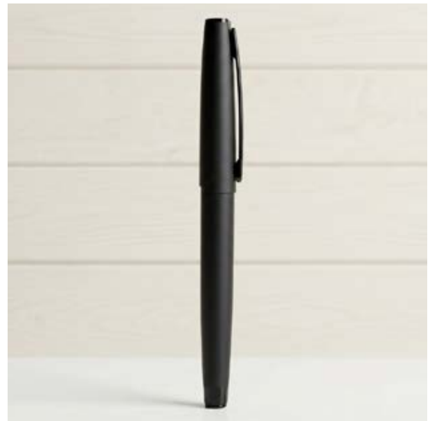
BOL 573 Bolígrafo Top Black