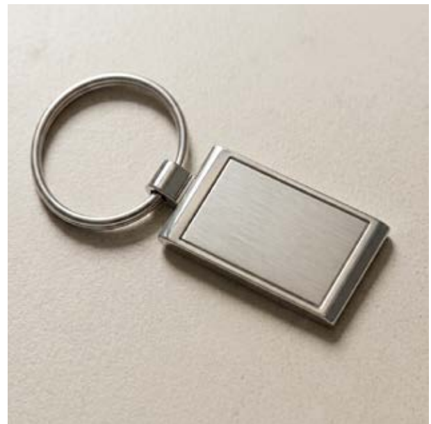
LLA 22 Llavero Rectangular Sencillo Plano