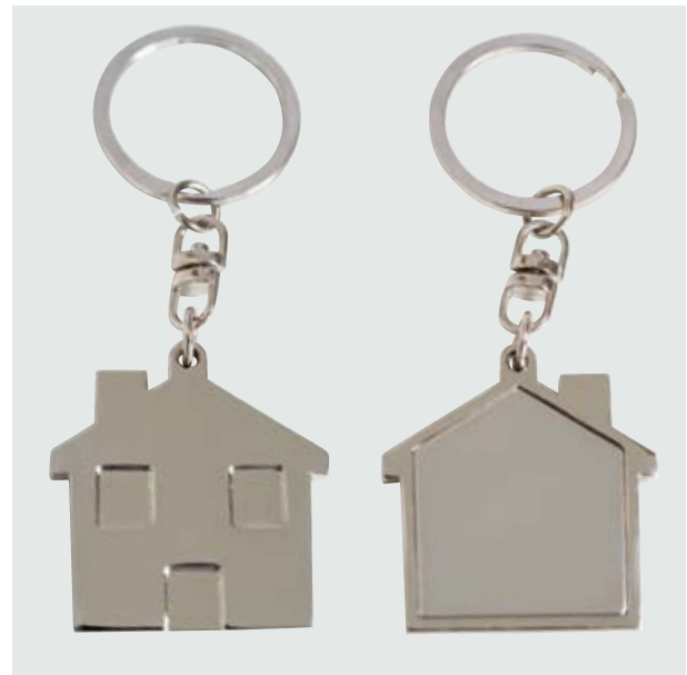
LLA 29 Llaverero Forma Casa