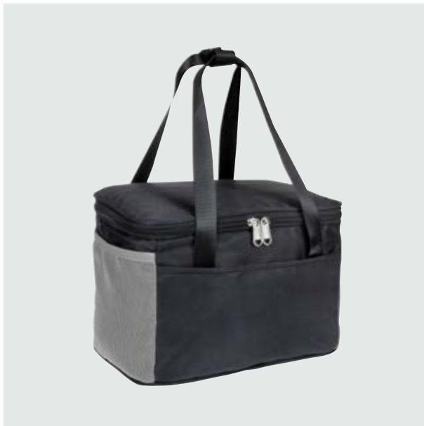
MAL 115 Lonchera Luca ■