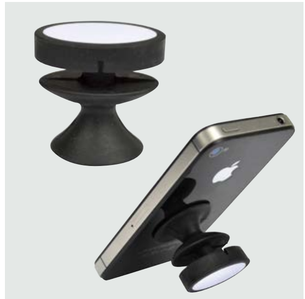
TEC 19 Stand Boyle