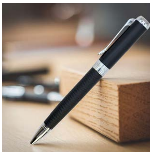
BOL 524 Bolígrafo Lautrec