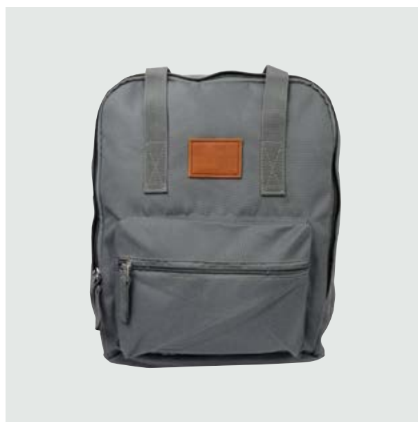
MAL 212 Backpack Karpov