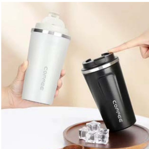
TH 08 Termo Alcatraz