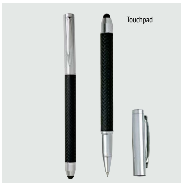
BOL 520 Bolígrafo Bernini