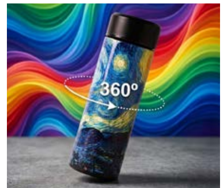
Full Color 360°

Consiste en transferir una pasta espesa de tinta a través de una malla tensada en un marco de madera o metálico. Esta técnica funciona solamente sobre superficies planas.