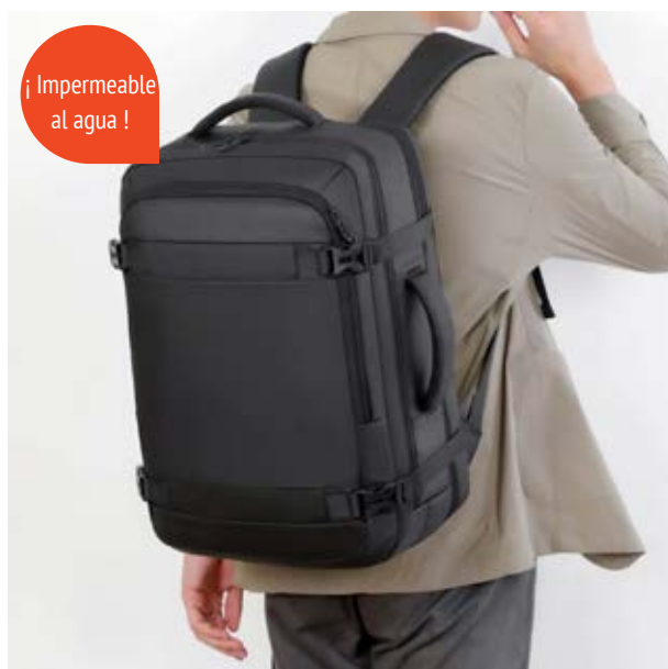
MAL 614 Backpack Ledecky