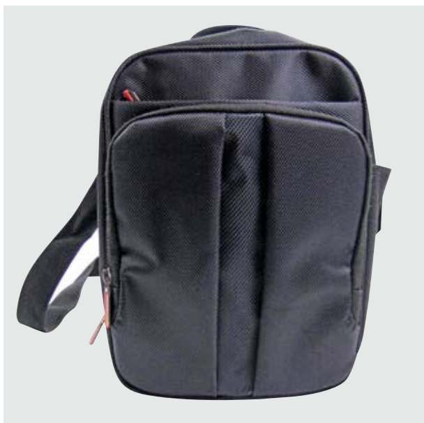
MAL 521 Bandolera Borg ■