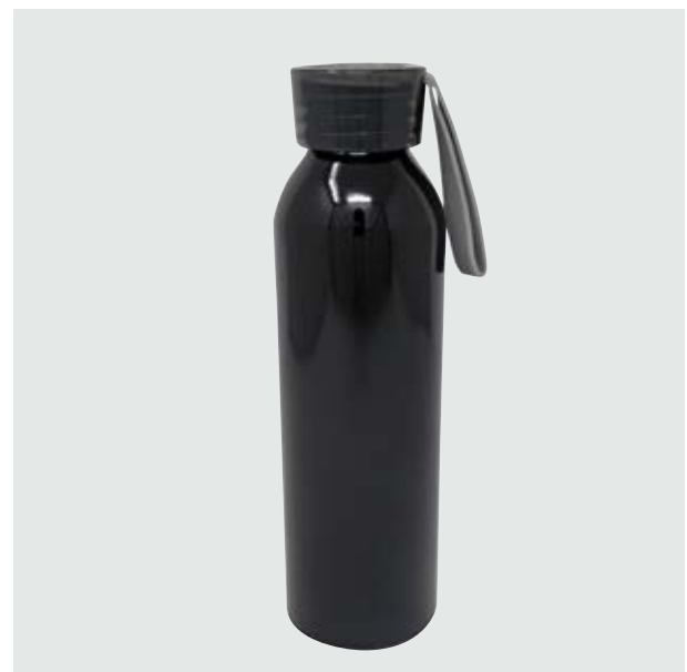
TH 111 Termo Ródano