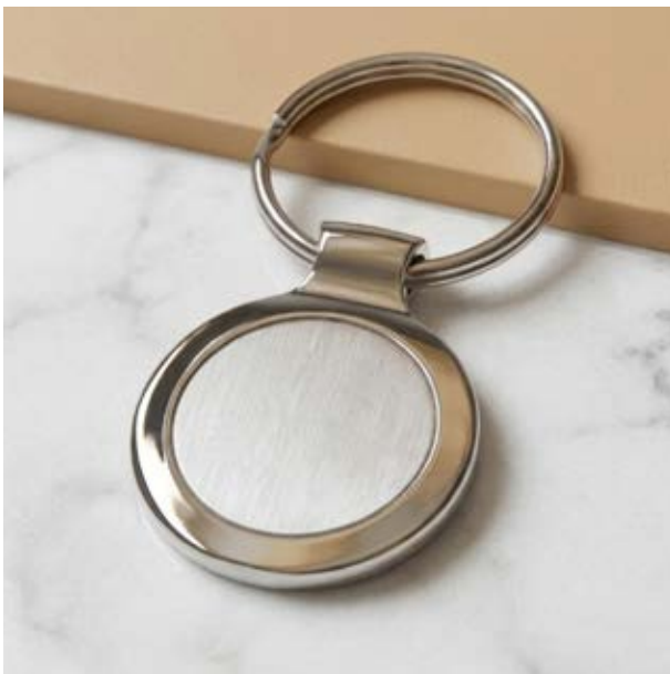
LLA 21 Llavero Redondo Sencillo Plano