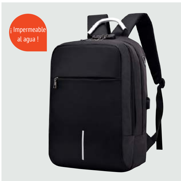
MAL 608 Backpack LeBron ■