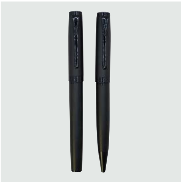
BOL 501 Set Bolígrafos Basquiat