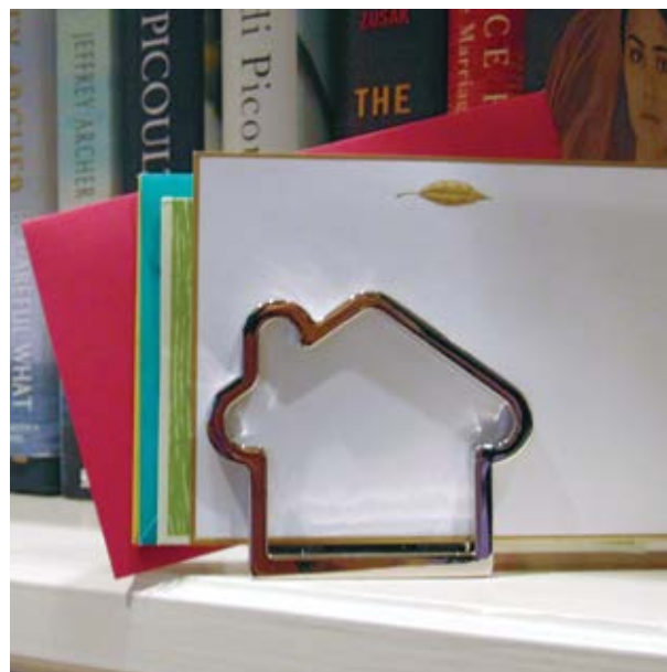
ESC 860 Porta Tarjetero Niza