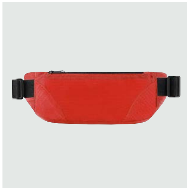
MAL 220 Cangurera Rodman