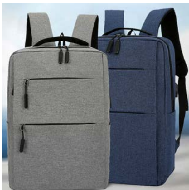
MAL 611 Backpack Duncan ■ ■