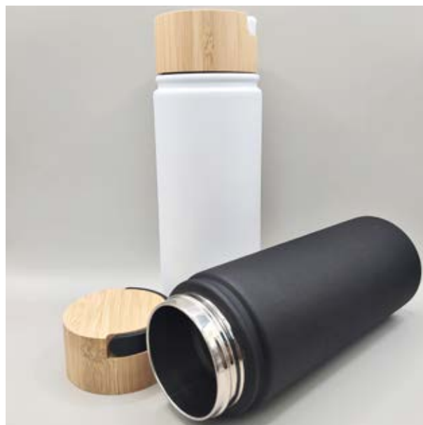
TH 13 Termo Ambar

Material: Acero inoxidable Medida: 19.5 x 7.4 cm diámetro