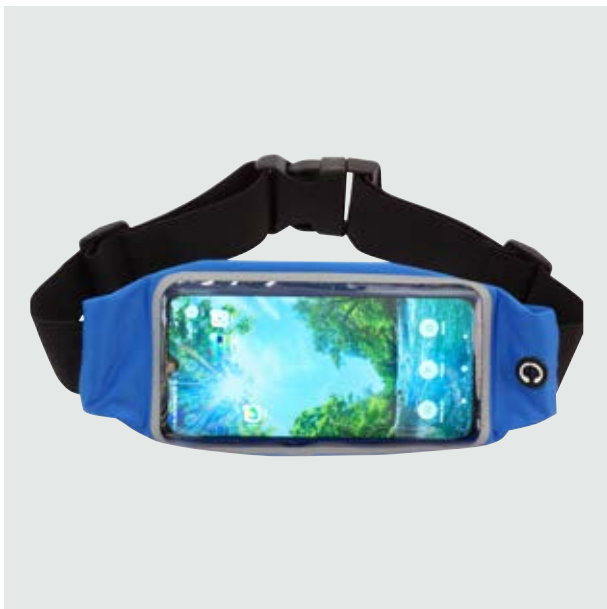
MAL 219 Sport Bag