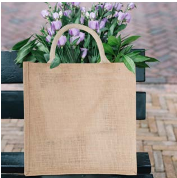
MAL 10 Bio Hand-Bag ■