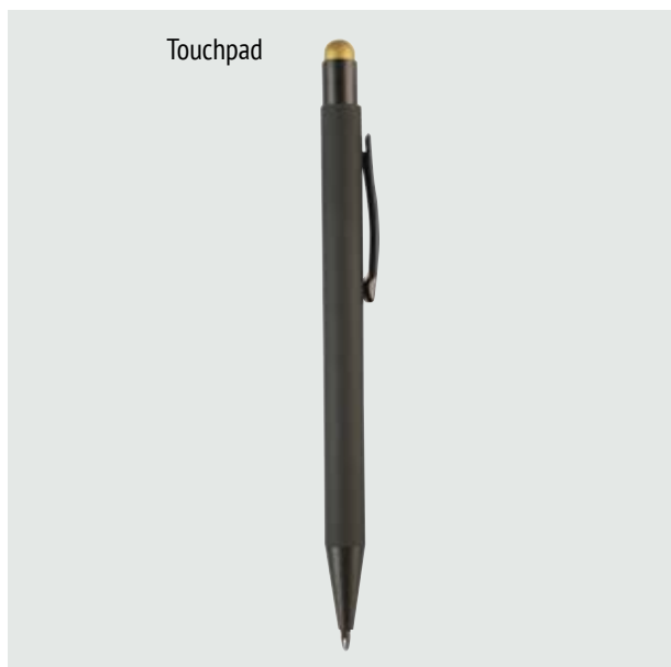
BOL 519 Bolígrafo Kandinsky