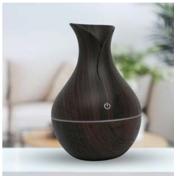
CAS 01 Vaporizador Contempo