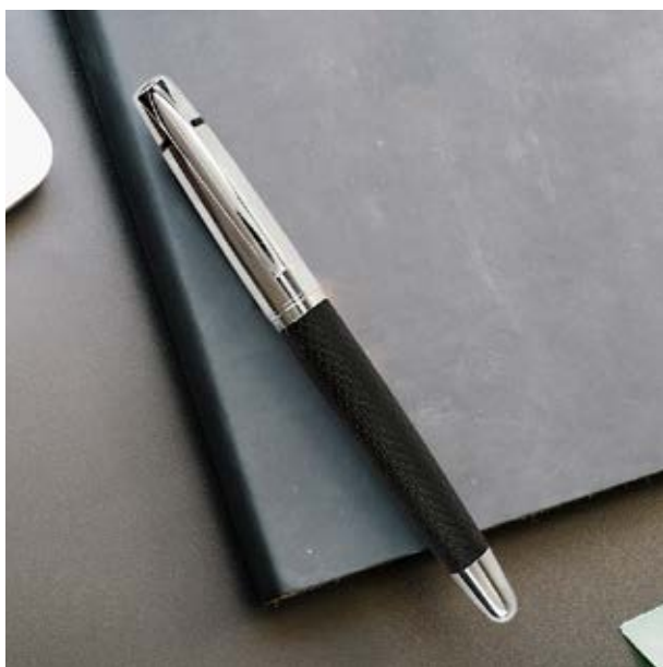
BOL 522 Bolígrafo Turner