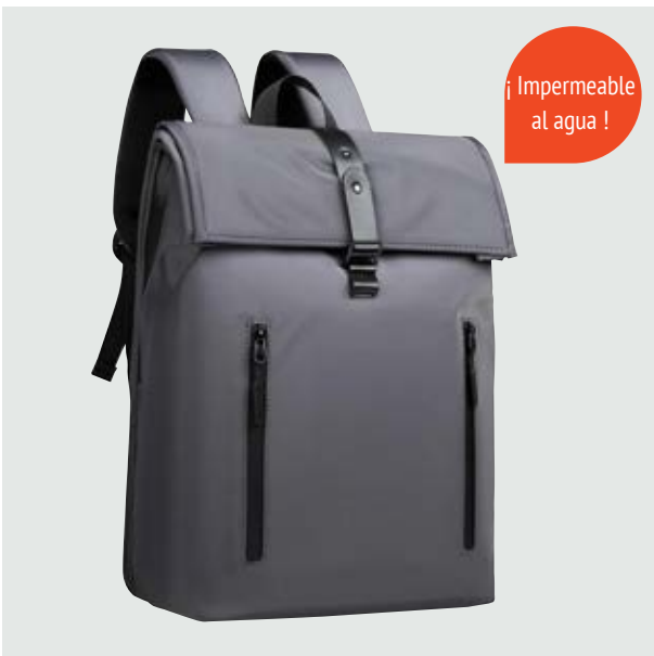
MAL 606 Backpack Iniesta