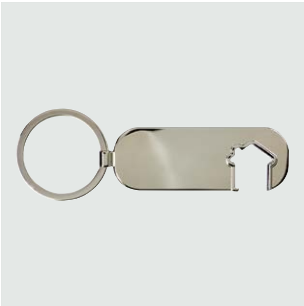
LLA 28 Llaverero Ranura-Casa