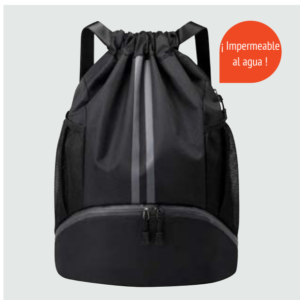
MAL 205 Backpack Durant ■