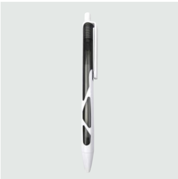
BOL 00 Bolígrafo Hooper