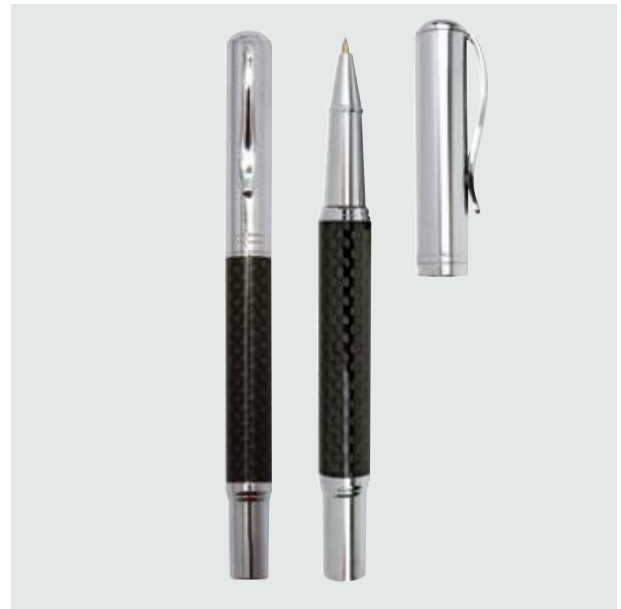
BOL 552 Bolígrafo Mónaco