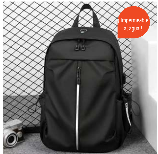
MAL 607 Backpack Kato