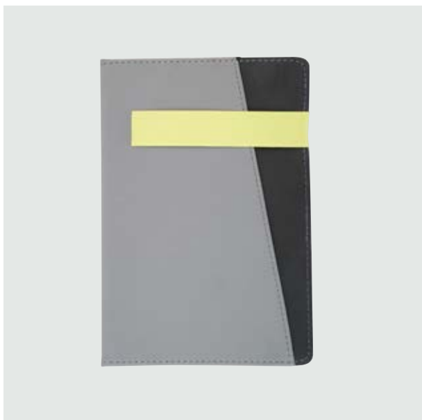
ESC 531 Libreta Moskú