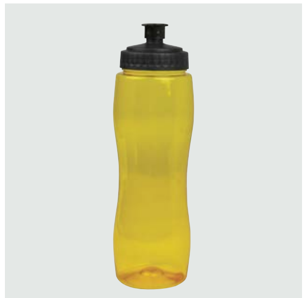
TH 105 Cilindro Ebano Traslúcido