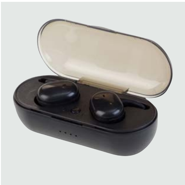
TEC 03 Audífonos Franklin ■