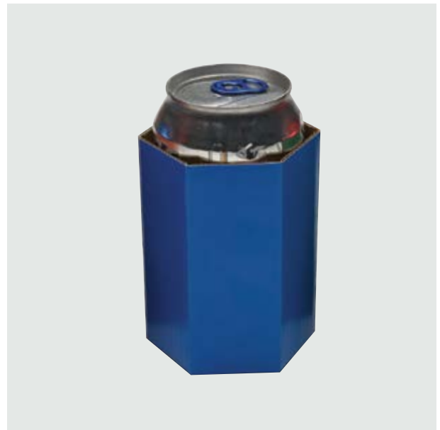
TH 306 Card Can-Holder