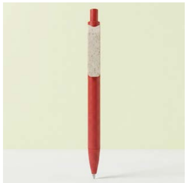
BOL 334 Bolígrafo Quinn